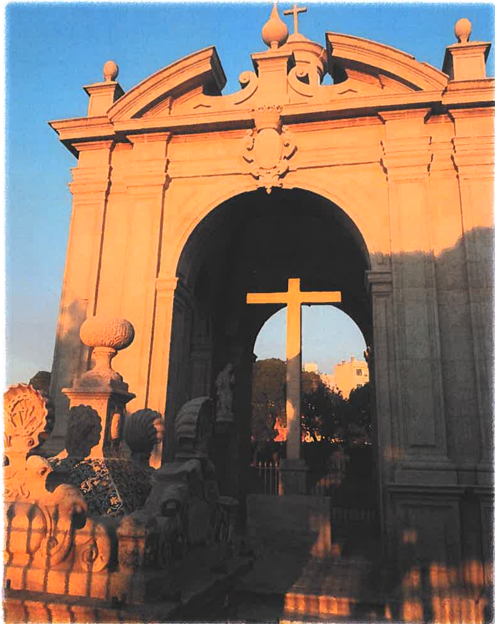
Zimbório do Senhor do Padrão